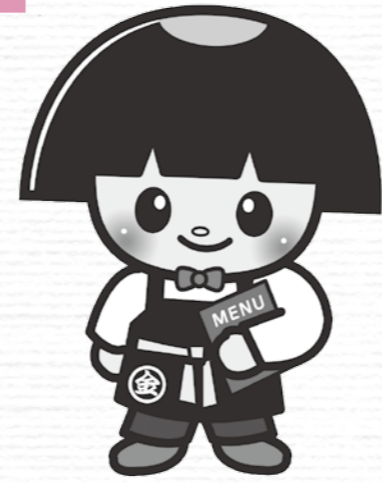
きんたくんバルバージョン

また、インターネットや電話で事前予約するとチケットを前売り価格で当日購入できますので、ご利用ください。チケットが残った場合も、10月20日(木)~23日(日)の「あとバル」期間中に、1枚700円の金券として使えます。詳しくはきんたくんバル実行委員会へ。