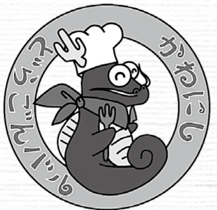
どらごんバルキャラクター

また、「スタンプラリー」を同時開催し、シールを集めて応募すると、抽選ですてきな賞品が当たります。詳しくは、能勢電鉄(株)内のかわにしどらごんバル実行委員会へ。