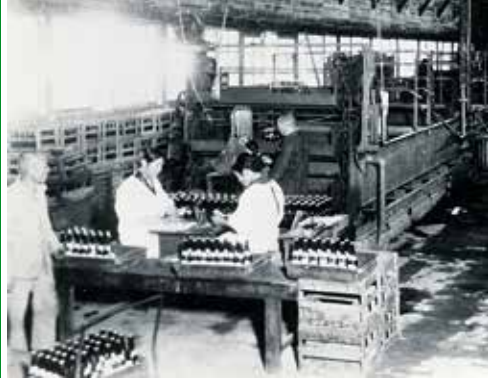
上：「平野水」の瓶詰めをしている工場 下：能勢電鉄の線路脇に今も残る「三ツ矢塔」 (敷地内に入ることはできません)