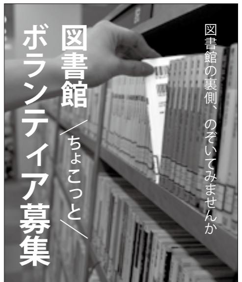
図書館の裏側、のぞいてみませんか ボランティア募集

留守家庭児童育成クラブ (学童保育) 支援員 4月1日採用の嘱託職員を若干名。試験は2月3日(土)。 ■放課後児童支援員が保育士、社会福祉士、幼稚園教諭、小・中・高等学校教諭のいずれかの資格を持つ人▽ ☎ 市役所3階の地域こども支援課に備え付けの申込書に必要事項を書き、1月26日(金)までに同課へ▽ ☎ (740) 1215 (公社)市シルバー人材センターの正職員 4月1日採用の正職員を1人。試験日は1月28日(日)。募集要項は、同センターホームページへ。 ■民間事業所などで3年以上営業や経理などの職務経験があり、普通自動車運転免許を持ち、パソコンの基本操作が可能なる人▽ ☎ 履歴書(写真貼付)と職務経歴書を、1月19日(金)必着までに〒666-0017・火打1-10-9の(公社)市シルバー人材センターへ▽ ☎ (758) 6234・ ☎ http://www.kawanishi-silver.or.jp/