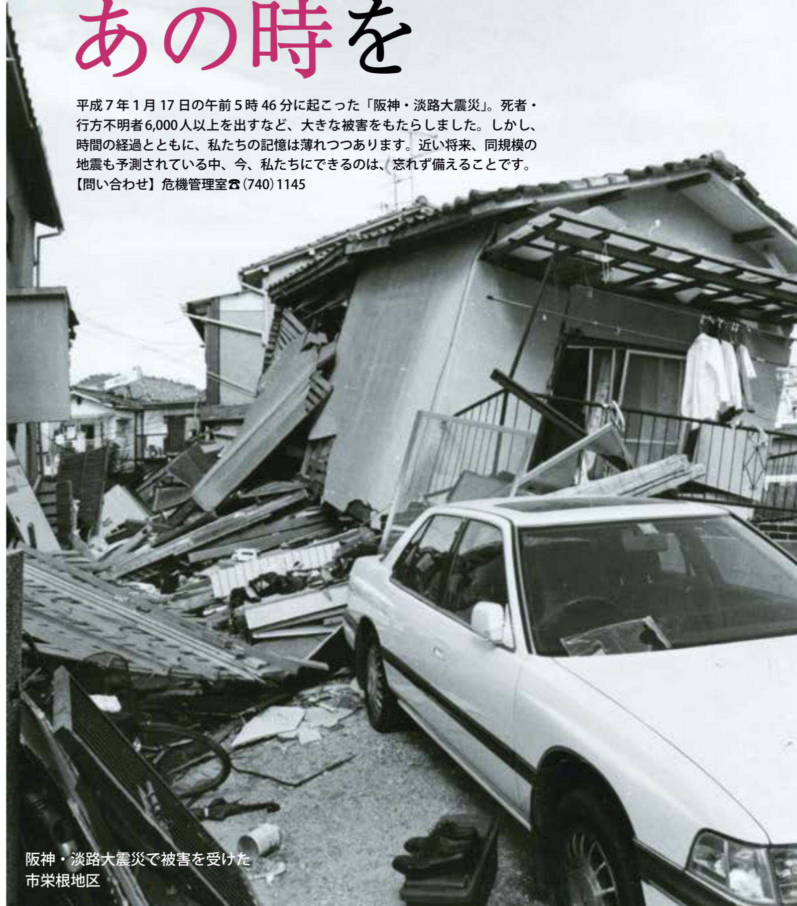
阪神・淡路大震災で被害を受けた市栄根地区