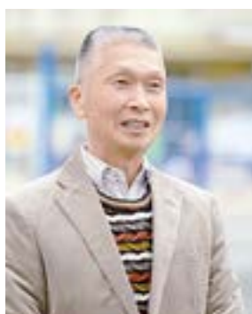
自主防災組織 連絡協議会

そんな時に地域でまず機能するのが、小学校区単位にある自主防災組織なんです。全国各地で組織されるようになったのは、阪神・淡路大