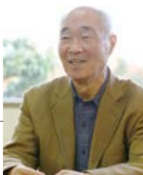
大和の夢かなえたい 実行委員会

大和地域では大きな被害はありませんでした。ですが、被災した人たちのために「何かできることはないか」という思いを持った人たちが集まり、自然発生的に企画が立ち上がったと聞いています。