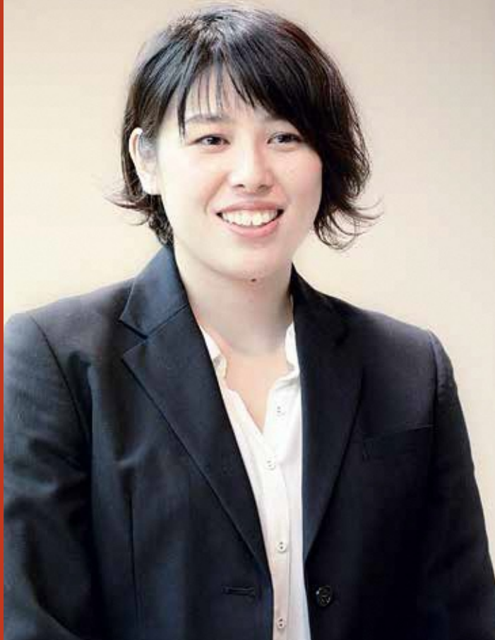
女子バレーボールチーム「NECレッドロケッツ」副キャプテン