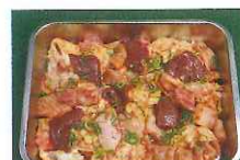
ホルモンミックス(1kg)