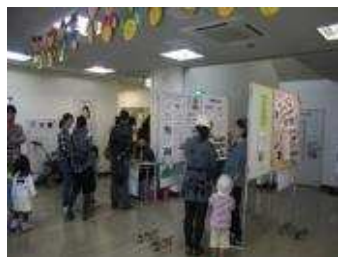
登録グループ展示