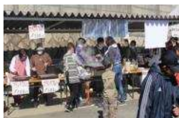
やきそばとフルーツの店