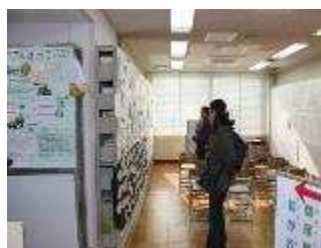
人権ビデオ上映・平和展示