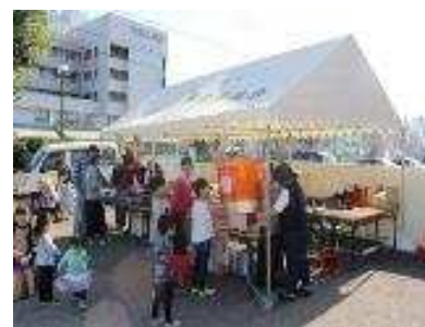
お菓子の店とキムチの店