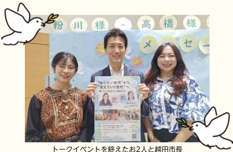
トークイベントを終えたお2人と越田市長

海外の映画関係者と話をすると、憧れの日本!といった感じで、日本人である自分よりも日本のアニメーションに詳しくったり、自分たちの国の作った物が受け入れられ、尊敬されていることをとても実感します。川西市については、こんなにも川西市出身ということで自分の活動を応援してくれる市が他には無いとよく言われます。温かい人たちが多いからこそだなというのはとても感じます。