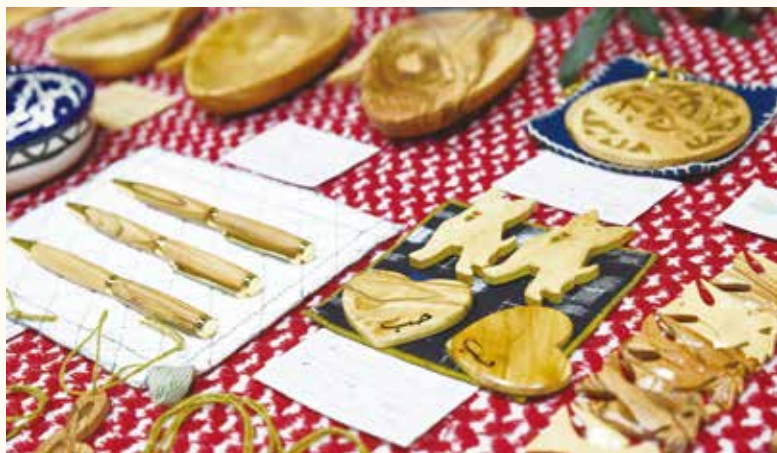
架け箸で販売しているパレスチナの工芸品

また、「架け箸」と繋がりがあある人が、「あの架け箸さんが売っているパレスチナのー」と考えてくれる。パレスチナに関するニュースで信じられないような言葉や映像が並んで、自身と遮断しそうになっても、でもあそこは架け箸さんが販売している物を作ってる場所です...というふうに変換して考えられたり。自分が活動することでパレスチナに対する印象・受け止め方が変わるきっかけになっているということ、活動から見えてきたことです。