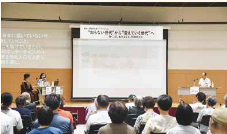
戦後・被爆80年トークイベントの様子