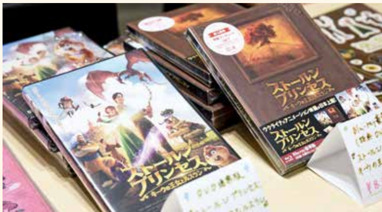
ウクライナのアニメーション映画 [THE STOLEN PRINCESS]のDVD

自分の志、目標に、様々な方が共感してくれて、一緒に手伝ってくれる。そうすると、多くの人を巻き込めて、自分でやるよりも選択肢が広がるとすごく感じました。自分一人では無理だったことも、たくさんのおかげで実現できました。巻き込む、みんなでやるってこういうことの大切さは学びになりました。また、ウクライナの映画を公開することが、ウクライナの支援に繋がる行動なのかと悩んだりしたん