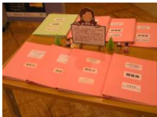
パレットかわにしでの閲覧

案件が重なった平成26年12月中旬から年度末までは、市役所1階に特設コーナーを設けて、資料の閲覧と意見提出がその場で行えるようにしました。