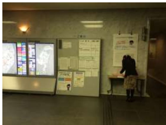
市役所1階特設コーナー