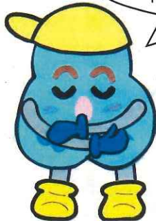
ぶっくりごみくん

ごみとして焼却処分していた家庭から出る剪定枝を活用していただくために、細かく砕いてチップ化できる「剪定枝粉碎機」を無料で貸出ししています。