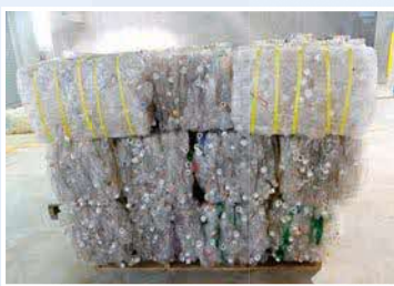
ペットボトルを固めた「ベール」

汚れたものや分別が間違っているものはベールにできないので、軽くすすいでも ①固形物 ②汚れ ③強いにおいの3点のどれかが残っていれば 燃やすごみ へ。