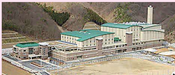
国崎クリーンセンター

そのほか、川西市がごみを搬入している国崎クリーンセンターは周辺の1市3町で運営しています。各市町の 燃やすごみ の量によってそれぞれの 負担金 が決まるので、ごみ減量やリサイクルでごみを減らせば、川西市の負担が少なくて済み、その分ごみ行政以外に税金を充てることができます。