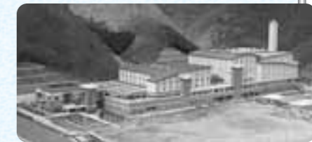
国崎クリーンセンター