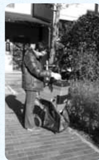
枝の太さはおよそ3.5cmまで粉碎できます

きっかけ 集合住宅に住んでいます。低木は住民が管理しており、皆で一斉に剪定を行っています。以前から剪定した枝を何とか活用できないかと思っていたので粉碎機をお借りしました。