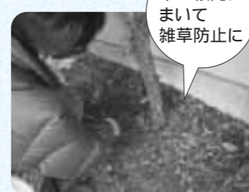
木の根元にまいて雑草防止に

チップの活用方法 チップ化したものは植木の植え込みにまくと、雑草防止になります。まいていないところと比べると雑草が生えていないことが一目瞭然です。時間はかかりますが、次第にボロボロになって土に混ざっていくのが分かります。今まで、ごみとして出すしかなかった枝木が有効に活用できて嬉しいです。今後も利用したいと思います。