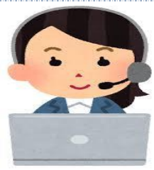
川西市医師会 川西市・猪名川町 在宅医療・ 介護連携支援センター