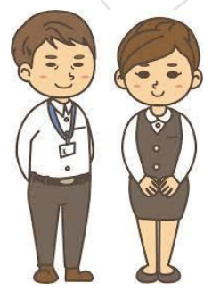
地域包括支援 センター