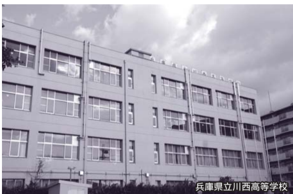
兵庫県立川西高等学校

今後は、新設校に入学する生徒のため、通学に利用するバス路線の整備などを要望していききたい。