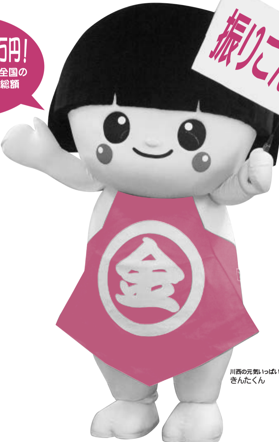
川西の元気いっぱいキャラクター きんたくん