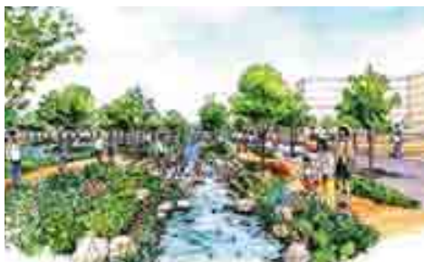
「せせらぎ遊歩道」イメージ

今後、市でこの事業区域を対象に土地区画整理事業によるまちづくりを、また、土地の権利者で土地利用を進めていきます。