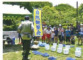
子どもを対象とした自然観察会

知明湖キャンプ場では、皆様のニーズにお応えした様々なイベントのお手伝いをしています。こんな事したい、あんな事したいなどご相談ください。いっしょに実現していきましょう。