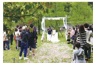
自然の中での結婚式

鉄鍋伝道倶楽部によるダッチオープンで料理を楽しむイベント。5月と10月にダッチオープン料理セミナー開催予定。