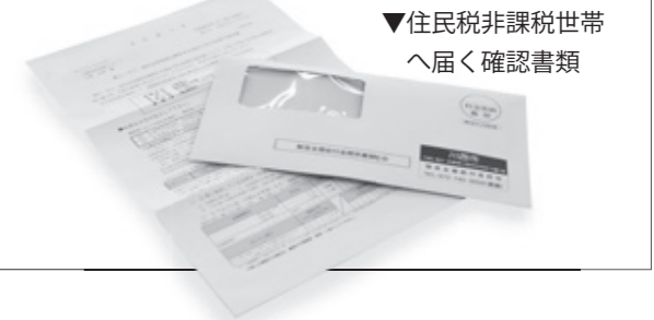
▼住民税非課税世帯へ届く確認書類