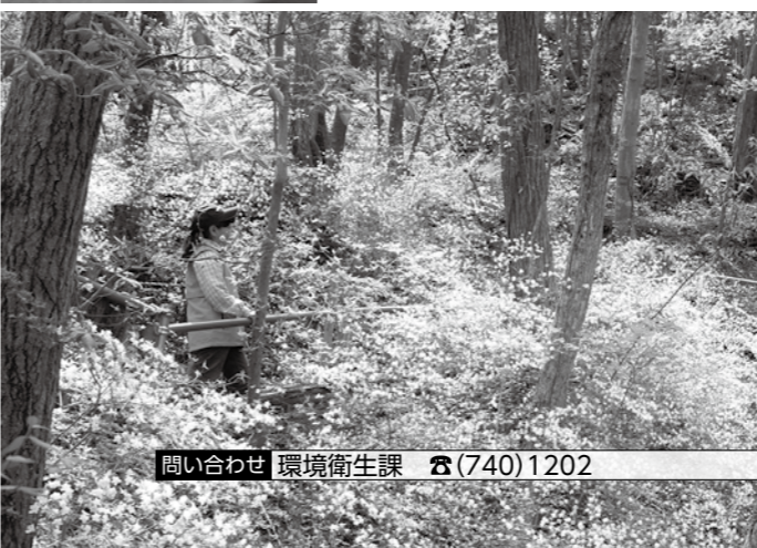
1_水明台の美しい自然景観の河川深谷にある、市域でも有数のエドヒガン群生地 2_日本一の里山といわれる黒川地区周辺の山林でヒメボタルがストロボのような光を放つ 3_清和台の虫生川両岸のコナラやクヌギの群落にあるシロバナウンゼンツツジ個体群