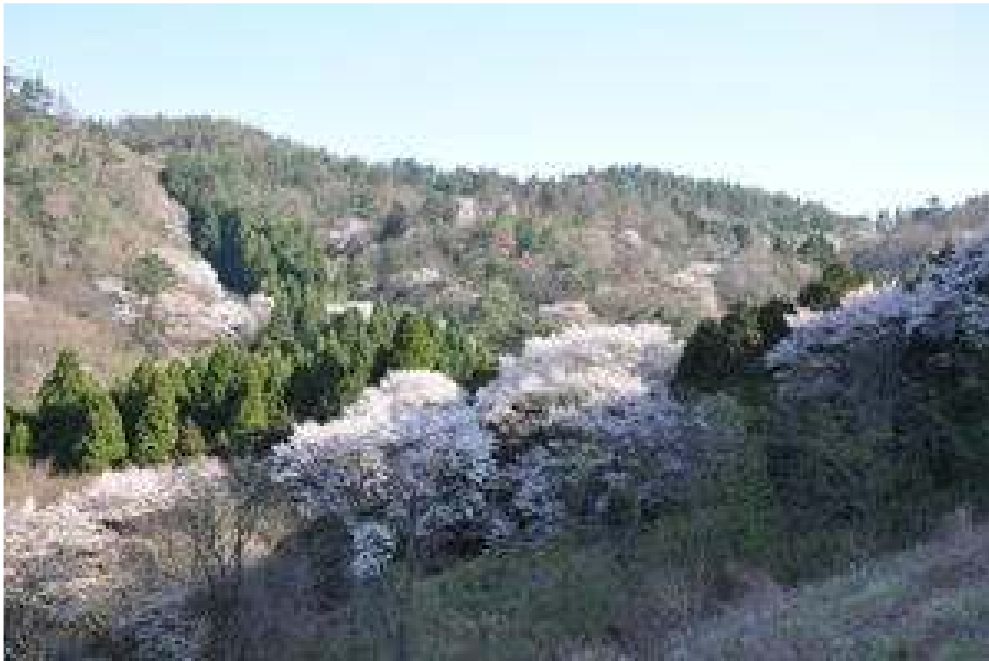
黒川桜の森(エドヒガン)