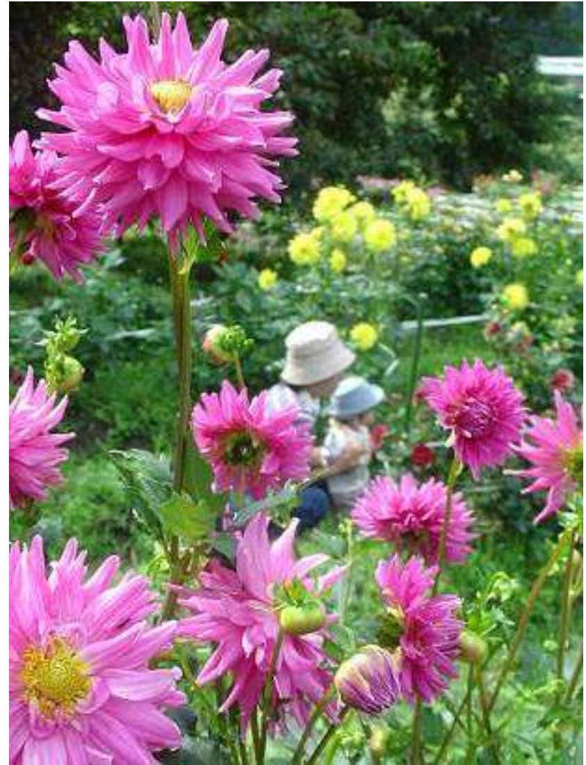
台場クヌギ 黒川ダリア園